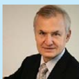
Караулов Александр Викторович академик РАН (Москва)