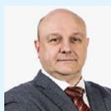
Тутельян Алексей Викторович чл.-корр. РАН (Москва)