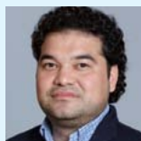
Хаитов Муса Рахимович чл.-корр. РАН (Москва)