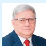
Михайлов Михаил Иванович чл.-корр. РАН (Москва)