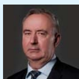
Симбирцев Андрей Семенович чл.-корр. РАН (Санкт-Петербург)