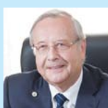
Лобзин Юрий Владимирович академик РАН (Санкт-Петербург)