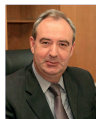
чл.-корр. РАН А.С. Симбирцев